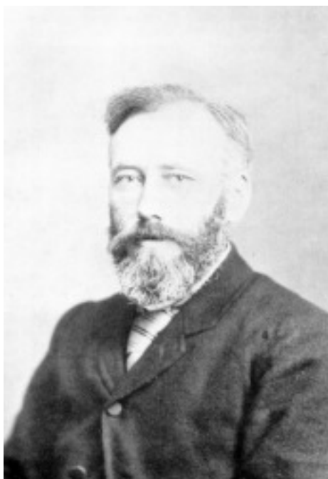
WILLIAM QUAN JUDGE (1851-1896)

De un retrato tomado por el estudio de Taber, 8 St. de Montgomery, San Francisco, California.