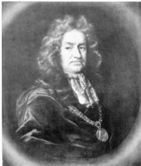
ELIAS ASHMOLE (1617-1692)