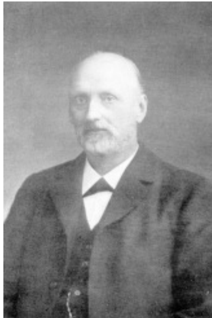
DR. JONAS GUSTAF WILHELM ZANDER (1835-1920) Reproducido de Universal Brotherhood , vol. XIV, noviembre, 1889 (Ver el bosquejo biográfico en el Apéndice Bio-Bibliográfico)

que disuelve la materia más dura...». El elixir vitae es solamente el agua de vida, como dice Godwin, «es la medicina universal que tiene el poder de rejuvenecer al hombre y prolongar indefinidamente su existencia».