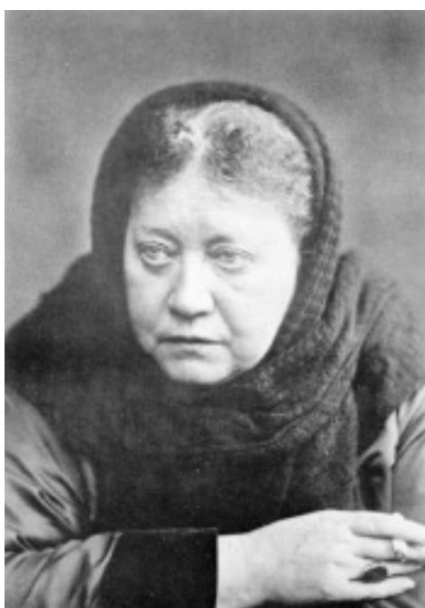
HELENA PETROVNA BLAVATSKY

tienen el derecho de entrar al Nirvana y prefieren renunciar a este estado de beatitud inducidos por una piedad sin límite para el mundo que yace en la ignorancia y sufre, se convierten en Nirmanakayas . Toman la vestidura Sambhogakaya (el cuerpo invisible) a fin de servir a la humanidad, es decir: viven una vida sentiente después de la muerte y sufren mucho al ver las miserias humanas (que no tienen la libertad de aliviar; ya que son, en la mayoría de los casos, Kármicas). Sufren para tener una oportunidad de inspirar a unos pocos con el deseo de aprender la verdad para, entonces, salvarse (Por lo general, todo lo que Schlagintweit y otros han escrito sobre el cuerpo Nirmanakaya es erróneo). Este es el verdadero sentido de la enseñanza Mahayana. El discípulo de la escuela Mahayana, en su discurso a los «Budás (o Bodhisattvas) de la confesión, dice, entre otras cosas, refiriéndose a esta enseñanza secreta: «Creo que no todos los Budas entran al Nirvana». FINAL NOTA). Sin embargo, admitiendo, en gracia al argumento, que de alguna manera fuéramos aptos para servir como sabios ejemplares para el «mundo» y mejorar a la «humanidad», ¿qué podríamos o deberíamos hacer?