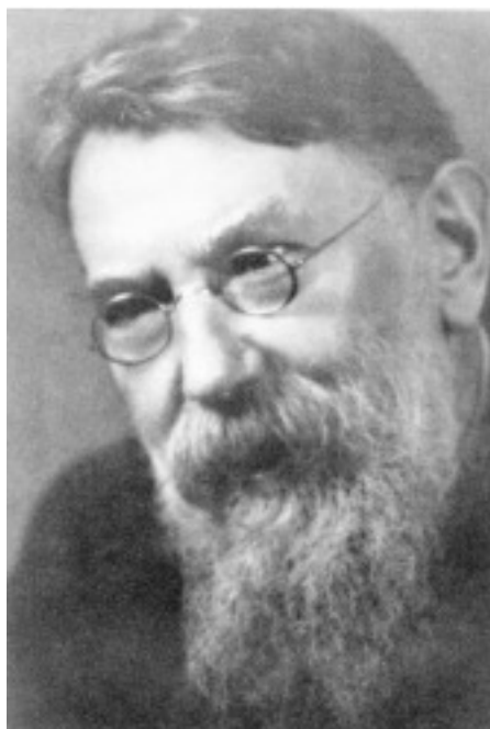
GEORGE WILLIAM RUSSELL, conocido como «Æ» (1867-1935)

puede separarse de las condiciones que la avasallan en la vida diaria; canjea su existencia ordinaria por otra, renuncia a los hábitos convencionales que pertenecen al orden externo de las cosas, para entregarse y mezclarse con otro orden de cosas que reina en ese estado de existencia más elevado... (NOTA: Jámblico, De mysteriis , VIII, 6 y 7. FINAL NOTA).