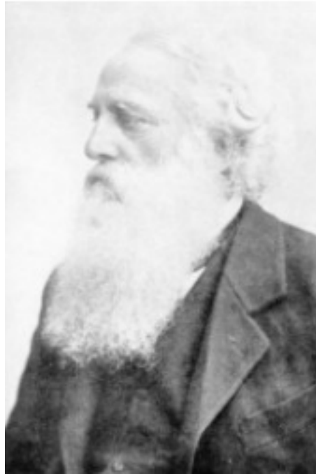
CORONEL HENRY STEEL OLCOTT (1832-1907)

Nuestros bondadosos críticos nos dicen: «¿No les basta que el mundo, a fuerza de ismos haya llegado al Teosofismo , que no es más que una charlatanería trascendental, sin que este último nos ofrezca una versión réchauffé de la magia medieval con su gran Sabbath e historia crónica?».