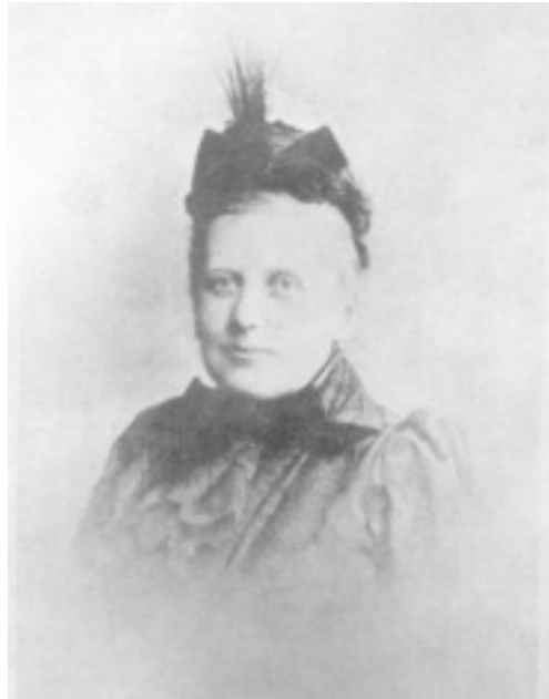
Foto tomada por Enrico Resta, el 8 de enero de 1889, en sus Estudios en 4, Coburg Place, Bayswater, Londres W. El plato de vidrio original, junto con otros cinco tomados al mismo tiempo, fueron vendidos por él en 1942 a La Sociedad Teosófica en Inglaterra, y ahora están en sus Archivos.