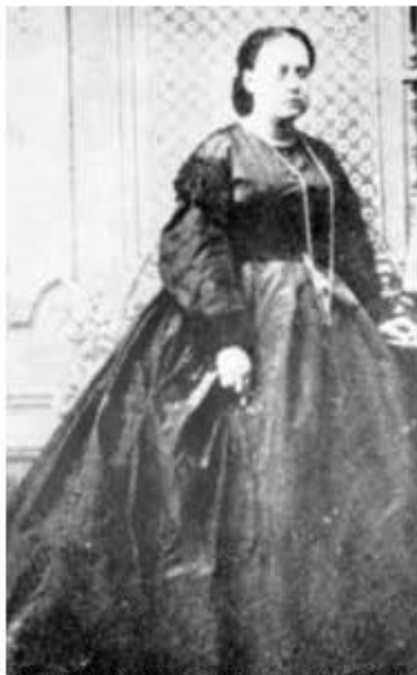
H. P. BLAVATSKY IN HER EARLY YOUTH